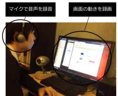
一般ユーザーの自宅でのテスト風景

本サービスの利用企業は、通常のアクセスログ解析では把握できない現場の生の情報やユーザーの声など、自社サイトの定性的な課題を抽出し、サイト改善に向けた具体策の検討に役立てること可能となります。