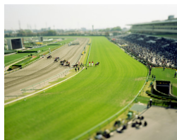
NAKAYAMA RACE-HORCE-TRACK CHIBA JAPAN