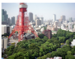
TOKYO-TOWER TOKYO JAPAN