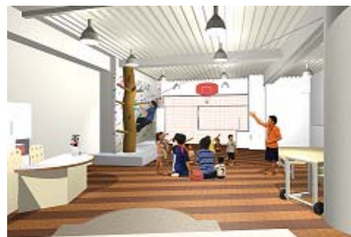
【店舗内装イメージ】

今回の店舗の目玉は、なんと言っても フリークライミングジム 豊洲・東雲エリアの新たな話題のスポットです！